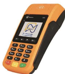
کارتخوان سیار مورفان H9