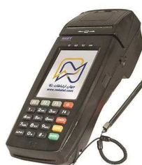
کارتخوان 8225 ثابت و سیار SZZT