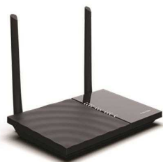
مودم روتر FM-1022