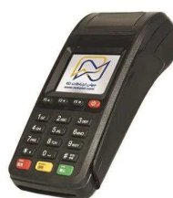
کارتخوان سیار نیولند مدل me31