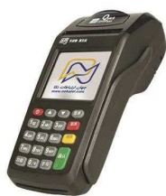
کارتخوان نیوپوز مدل 7210