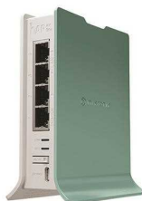
میکروتیک hAP ax lite